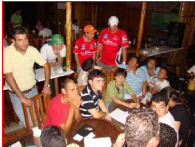
Anoche Jueves 04 de Junio, se reunieron los primeros integrantes de La Barra Sancarleña: Los del Norte. Hoy continúan con sus ensayos.