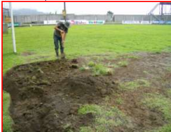
Ahora el sector de las áreas recibe mejoras en el cambio del césped actual.